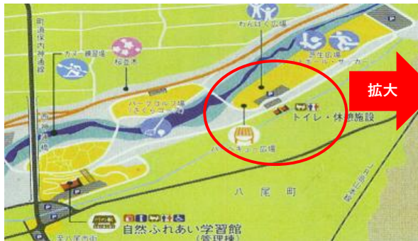
【バーベキュー広場の拡大図】